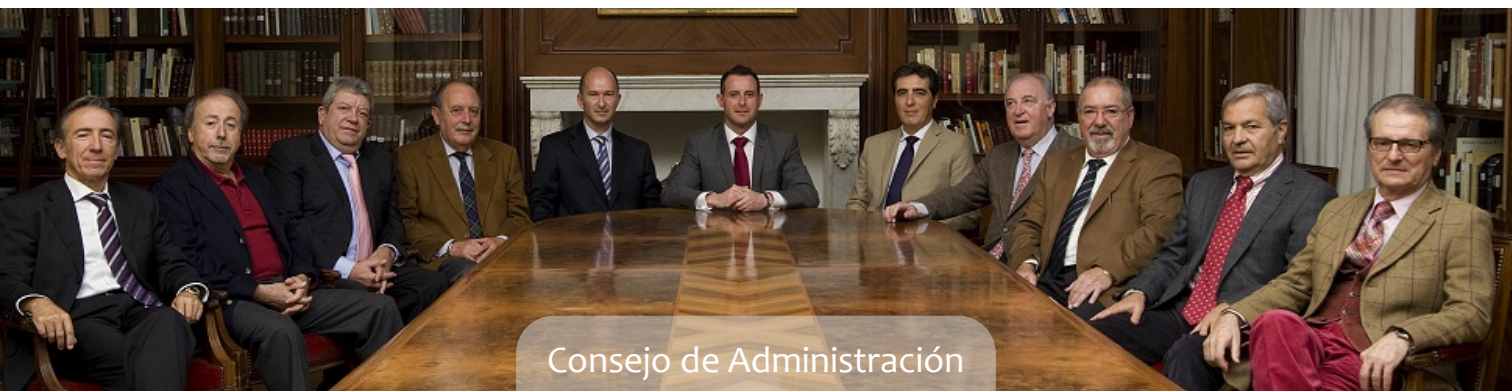
Consejo de Administración